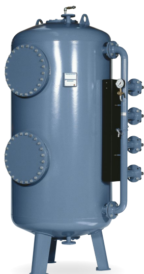
Trykfilteranlæg type TFB 14.