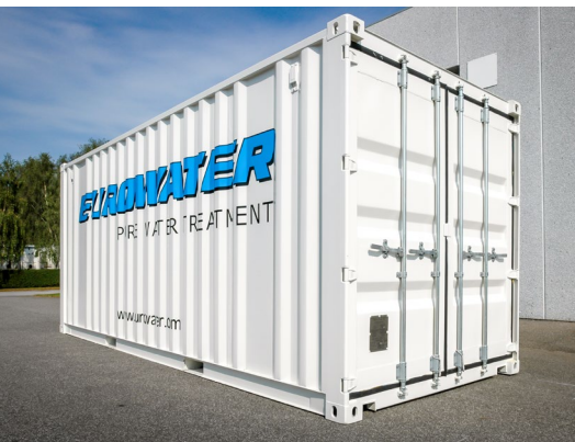
Komplet vandbehandlingsanlæg i container – klar til brug. Til leje eller salg.