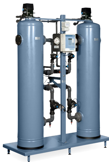
Blødgøringsanlæg type SMH 362-F.