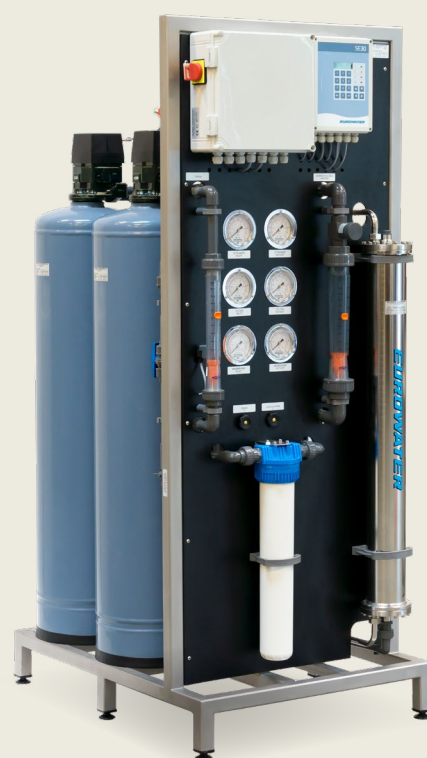
Rammemonteret CU:RO kompaktanlæg; et komplet omvendt osmoseanlæg bygget sammen med et forbehandlingsanlæg på en ramme af rustfrit stål – klar til brug.

De mange års erfaring, seriefremstilling og et modulopbygget standard-system garanterer driftssikre anlæg, kort leveringstid og konkurrencedygtige priser.